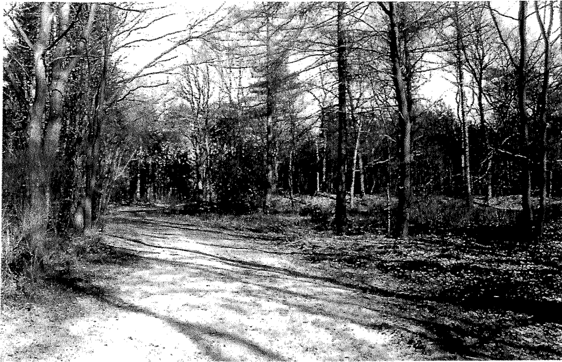
Vlakbi'j de Balkweg lag vroeger et oolde karkhof.

in de onderste laogen, de rooswinkels in de laogen daorboven en veerder wodde bouwd mit ni'je stiender. Een hiel stok bouwhistorie is zo an de karkemuren of te lezen. Bi'j et opni'j bruken van oold bouwmateriaol gong et trouwens niet allienig om de bakstiender, mar ok liekegoed om de vloertegels en et hooltwark in de kapkonstruktie en an et gewelf, zo het uut onderzoek bi'j de resteraosie van de karke in 2007-2008 blieken daon. 9 Vaeks wodt et ien en aander wat over de bouwhistorie van de verschillende karkegebouwen beweerd is, nog es bevestigd deur de oolderdom van de beide luudklokken die in et klokhuis hangen. De ooldste is van ongeveer 1300 en de jongste van 1502. 10