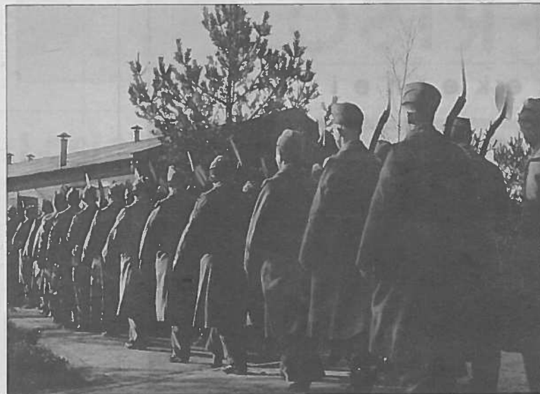
Foto 1: Tijdens het marcheren zongen ze marsliedertjes uit de zangbundel van de NAD. Ze hadden dan 'de mooie schep' over het schouder.

Mevrouw De Vries vertelde tevens dat ze een keer met een buurmeisje naar een open avond in het kamp was geweest. Dit op uitnodiging van de jongens die bij hen kwamen. Die jongens vonden het prachtig dat ze kwamen. Op onze vraag of hun ouders dit