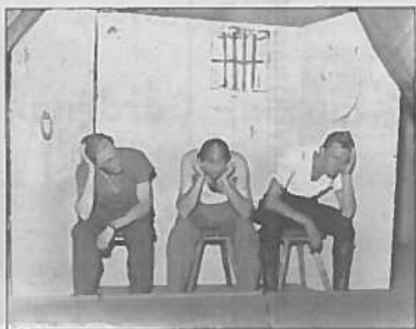
Tonieltik kamp Donkerbroek 1945.

tijd voor vertier in het kamp, zie bijgaande foto's van toneel in het kamp. Op 8 november 1945 komt er een geruisloos einde aan deze episode van het bataljon Friesland. In het donker van de ochtend worden de mannen op Canadese trucks geladen. In de stromende regen klautert men in het kolengruis waar de open vrachtauto's daarvoor gebruikt waren. Er is niemand aanwezig om afscheid van de mannen te nemen. De reis naar Nederlands Indië is voor hen begonnen.