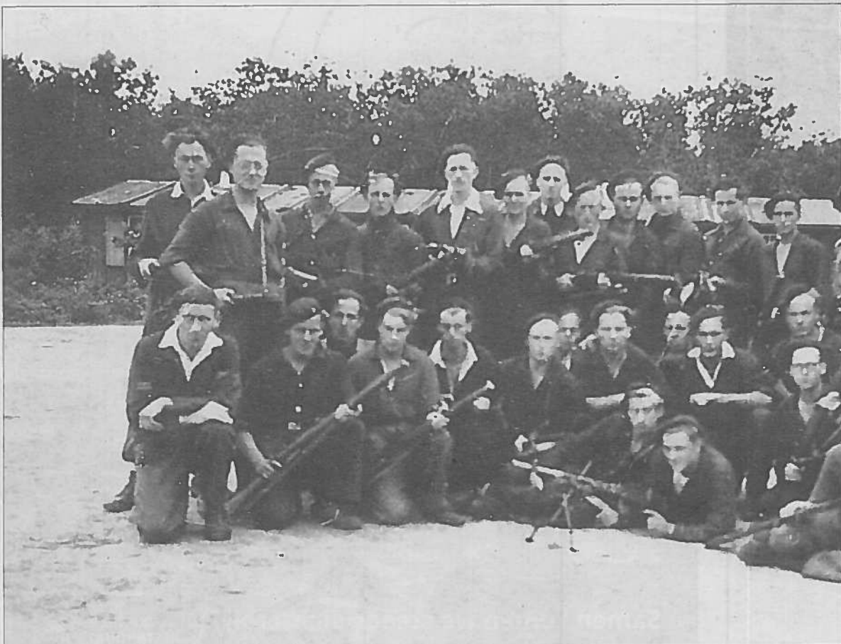
Groepsfoto OVW-ers Donkerbroek.