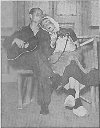
De bard van Donkerbroek (en het meisje dat geen meisje was).