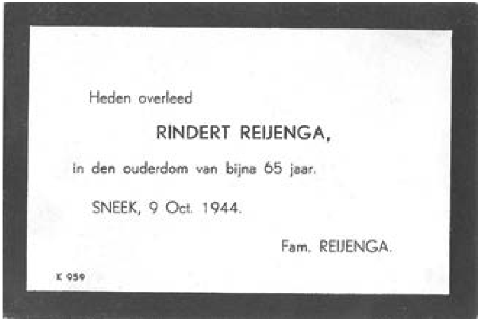
Rouwkaart Rinder Rijenga.