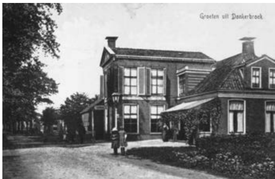
De vaste vergaderlocatie, Hotel Dokter.