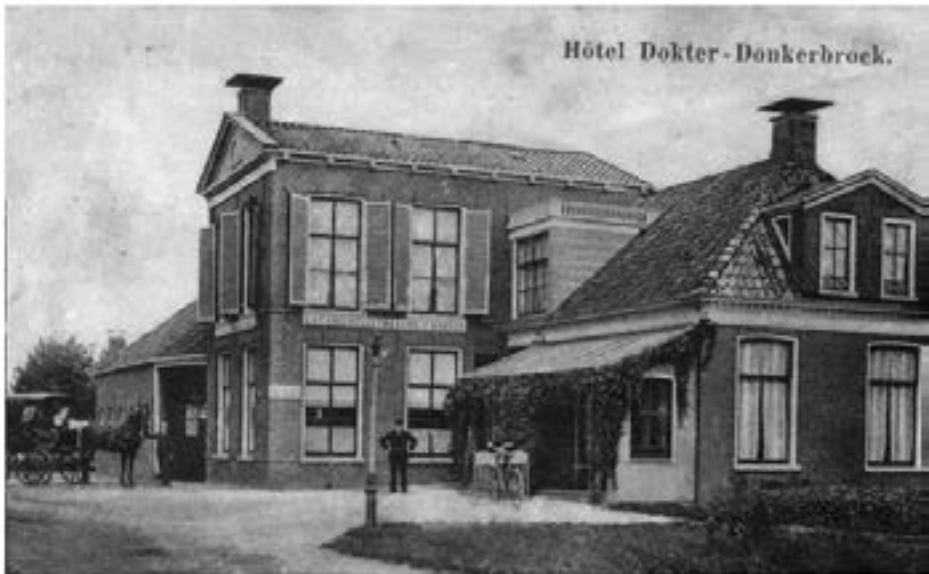
De vaste vergaderlocatie Hotel Dokter (tegenwoordig G.W. Smitweg 12)

Dit soort verenigingen kwamen veel voor in de verveningsgebieden, waar grote armoede heerste. De vereniging Werkverschaffing blijkt bereid tot een lening en stelt het geld beschikbaar (" disponibel " staat in het notulenboek) tegen een rente van 3,5 % en een jaarlijkse aflossing van 50 gulden. Voor het gebruik van het erf van de heer Van Dijk betaalt de begrafenisvereniging 5 gulden erfpacht per jaar hetgeen in een akte zal worden vastgelegd.